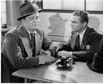
1945 DU SANG DANS LE SOLEIL (Blood on the Sun) de Frank Lloyd avec Wallace Ford