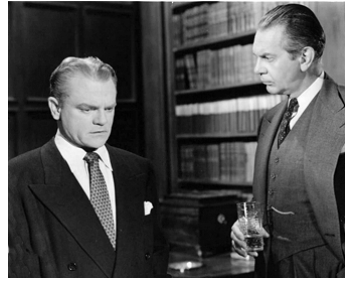
1951 FEU SUR LE GANG (Come till the Cup) de Gordon Douglas avec Raymond Massey