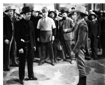
1938 LA TERREUR DE L'OUEST (The Oklahoma Kid) de Lloyd Bacon avec Humphrey Bogart