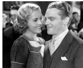
1934 LE CABOCHARD (The St. Louis Kid) de Ray Enright avec Patricia Ellis