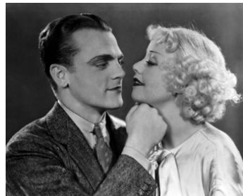
1933 UN DANGER PUBLIC (Picture Snatcher) de Lloyd Bacon avec Alice White