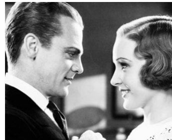
1933 LE BATAILLON DES SANS-AMOUR (The Mayor of Hell) d' Archie Mayo avec Madge Evans