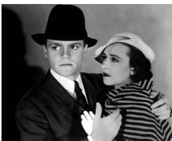
1935 LES HORS-LA-LOI (The «G» Men) de William Keighley avec Margaret Lindsay