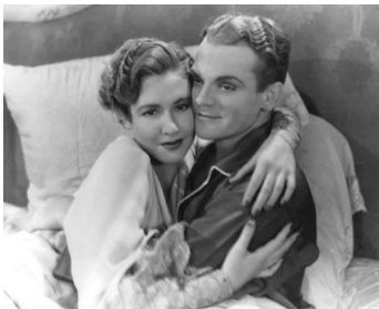
1933 LE TOMBEUR (Lady Killer) de Roy Del Ruth avec Mae Clarke