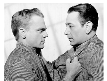
1939 À CHAQUE AUBE JE MEURS (Each dawn I die) de William Keighley avec George Raft