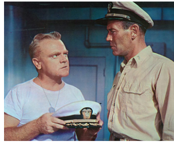
1954 PERMISSION JUSQU'À L'AUBE (Mr Roberts) de John Ford & M. LeRoy avec Henry Fonda