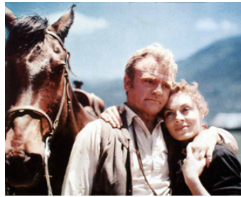
1954 À L'OMBRE DES POTENCES (Run for cover) de Nicholas Ray avec Viveca Lindfors