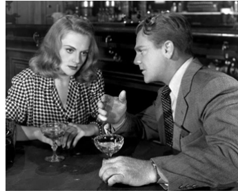
1948 LE BAR AUX ILLUSIONS (The Time of your Life) d'H. C. Potter avec Jeanne Cagney