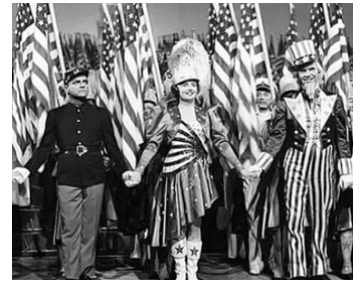
1942 LA GLORIEUSE PARADE (Yankee Doodle Dandy) de M. Curtiz avec R. DeCamp, W. Huston