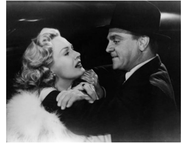
1949 L'ENFER EST À LUI (White Heat) de Raoul Walsh avec Virginia Mayo