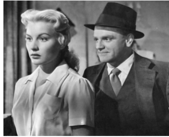
1950 LE FAUVE EN LIBERTÉ (Kiss tomorrow goodbye) de G. Douglas avec Barbara Payton