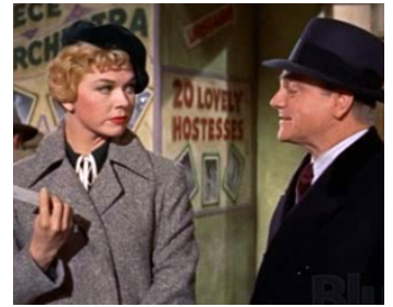
1955 LES PIÈGES DE LA PASSION (Love me or leave me) de Charles Vidor avec Doris Day