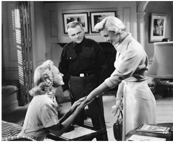
1950 LES CADETS DE WEST POINT (The West Point story) de R. Del Ruth avec V. Mayo, Doris Day