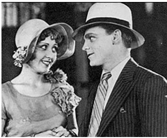
1930 SINNER'S HOLIDAY de John G. Adolff avec Joan Blondell