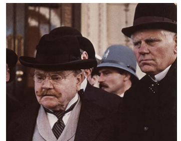
1981 RAGTIME (Ragtime) de Milos Forman avec Pat O'Brien