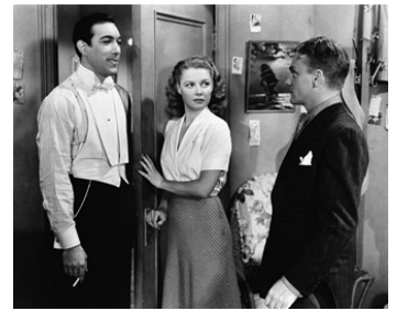
1940 VILLE CONQUISE (City for Conquest) d'Anatole Litvak avec A. Quinn, Ann Sheridan