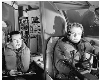
1941 LES CHEVALIERS DU CIEL (Captains of the Clouds) de M. Curtiz avec Reginald Gardiner