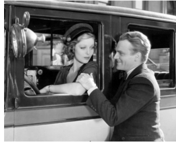
1931 TAXI ! (Taxi) de Roy Del Ruth avec Loretta Young