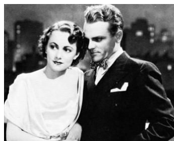
1935 TÊTE CHAUDE (The Irish in us) de Lloyd Bacon avec Olivia de Havilland