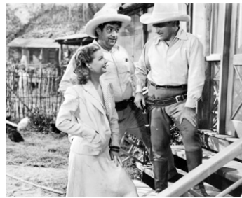
1940 ZONE TORRIDE (Torrid Zone) de William Keighley avec Ann Sheridan, Andy Devine