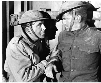
1939 LE RÉGIMENT DES BAGARREURS (The fighting 69th) de W. Keighley avec George Brent