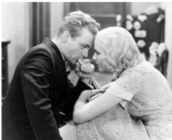
1932 L'AFFAIRE SE COMPLIQUE (Hard to handle) de Mervyn LeRoy avec Mary Brian