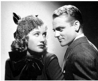
1939 LES FANTASTIQUES ANNÉES 20 (The roaring twenties) de Raoul Walsh avec Priscilla Lane