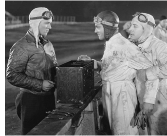
1932 LA FOULE HURLE (The Crowd roars) d'H. Hawks avec Eric Linden, Frank McHugh