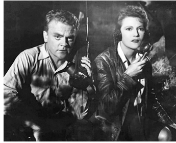
1946 13, RUE MADELEINE (13 Rue Madeleine) d'Henry Hathaway avec Annabella