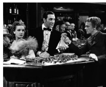
1935 ÉMEUTES (Frisco Kid) de Lloyd Bacon avec Lili Damita, Ricardo Cortez