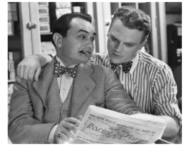
1931 LE BEAU JOUEUR (Smart Money) d'Alfred E. Green avec Edward G. Robinson