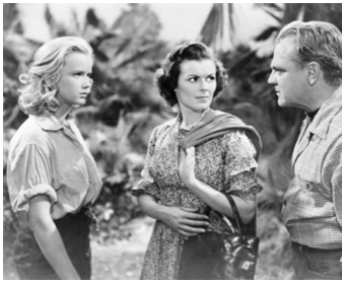
1953 L'HOMME À ABATTRE (A Lion in the Streets) de Raoul Walsh avec Anne Francis, Barbara Hale