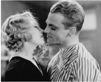
1931 LA FOLLE BLONDE (Blonde Crazy) de Roy Del Ruth avec Joan Blondell