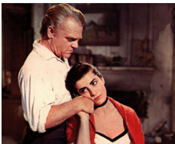
1955 LA LOI DE LA PRAIRIE (Tribute to a bad man) de Robert Wise avec Irene Papas