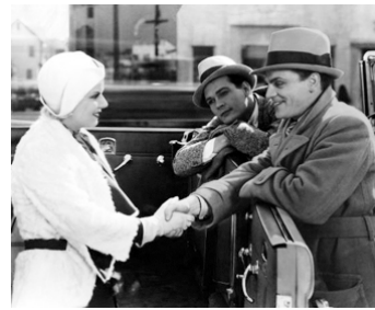
1931 L'ENNEMI PUBLIC (The Public Enemy) de W. Wellman avec Jean Harlow, Donald Cook