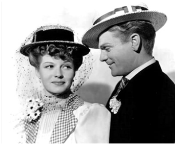
1940 UN DIMANCHE APRÈS-MIDI (The strawberry Blonde) de Raoul Walsh avec Rita Hayworth