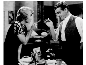
1933 PROLOGUES (Footlight Parade) de Lloyd Bacon avec Joan Blondell