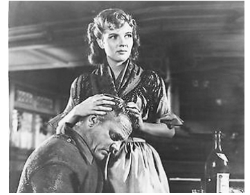
1952 DEUX DURS À CUIRE (What price glory ?) de John Ford avec Corinne Calvet