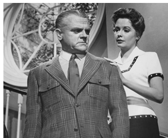
1957 L'HOMME AUX MILLE VISAGES (Man of thousand faces) de J. Peveny avec Jane Greer