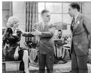
1933 JIMMY THE GENT de Michael Curtiz avec Alice White, Ralf Harold