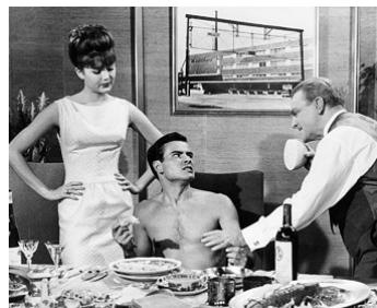
1961 UN, DEUX, TROIS (One, two, three) de Billy Wilder avec Pamela Tiffin, Horst Buchholz