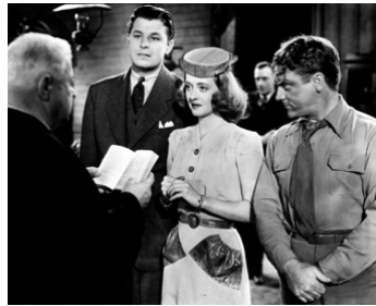
1941 FIANCÉE CONTRE REMBOURSEMENT (The Bride came C.O.D.) de W. Keighley avec J. Carson, B. Davis