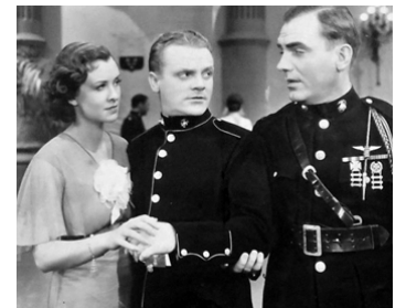
1934 LE BOUSILLEUR (Devil Dogs of the Air) de L. Bacon avec Margaret Lindsay, P. O'Brien